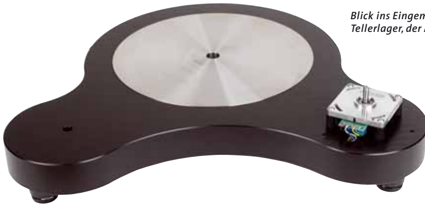
Blick ins Eingemachte: Die dicke Edelstahlplatte sorgt für Ruhe am Tellerlager, der Motor ist ein drehmomentstarker Industrieantrieb

Bekannter, werkelt hier doch der gleiche umfangreich modifizierte Gleichstromantrieb, den wir schon kennen. Ein externes Steuergerät – auch das hat sich optisch in letzter Minute noch ein wenig verändert – besorgt die per Mikrocontroller generierten Steuerfrequenzen, die sich bequem justieren und unverrückbar speichern lassen. Als Bindeglied zwischen dem Metall-Pulley des Motors und dem Plattenteller dient in bewährter Manier ein Gummi-Flachriemen; auch den gab's nicht irgendwo von der Stange zu kaufen, sondern ist eine Sonderanfertigung für TW-Acusic.