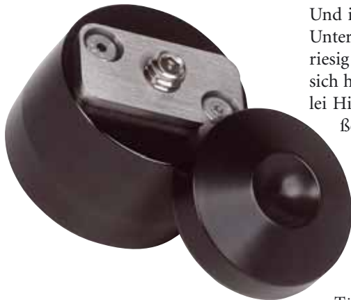
Spezialversion: Das Laufwerk steht auf einer eigens dafür gefertigten Version der bekannten „Still Points“