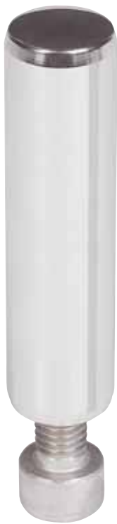
Von im wahrsten Sinne des Wortes zentraler Bedeutung: die Achse des invertierten Lagers