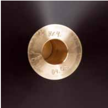
Die Lagerhülse des Raven One ist in den Teller eingepresst