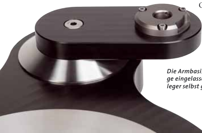
Die Armbasis des Raven One wird mit einem in die Zarge eingelassenen Edelstahlklotz verschraubt, den Ausleger selbst gibt's demnächst serienmäßig in Bronze