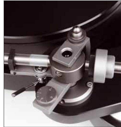
Der Audioquest-Arm ist mit einer Dämpfungseinrichtung ausgestattet, die hier mit Flüssigkeit befüllt werden kann

Jedenfalls lässt die Herter Einsteigerofferte mal gar keinen Zweifel daran, wes Geistes Kind er ist und knallt einem die Bläsersätze nur so