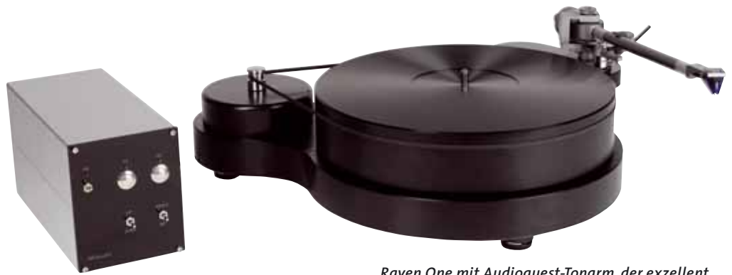
Raven One mit Audioquest-Tonarm, der exzellent zu dem Laufwerk passt. Das Netzteilgehäuse (links) wird derzeit noch etwas aufgehübscht

Der Raven One ist nun – wen wundert's – ein „Downsizing“ der beiden großen Brüder, und weil die sich schon ziemlich ähnlich sind, betritt TW auch beim One kaum echtes Neuland. Auch der Raven One ist eine mächtige, im wesentlichen schwarze Skulptur aus Kunststoff und Edelstahl. Der dunkle Baustoff, aus dem Teller und Zarge bestehen, ist nun keineswegs etwas, von dem man bei lokalen Großhändler mal eben ein paar Zuschnitte bestellen könnte, sondern ein ganz besonderes Zeug: Zugrunde liegt die Rezeptur für ein Material namens POM, aber Tom Woschnicks Variante enthält noch ein paar Zusätze, über die er sich verständlicherweise nicht so gerne auslässt. Woraus Sie folgern dürfen, dass TW sich dieses Material eigens in Platten gießen lässt, was die Sache nicht eben preiswert macht. Solcherlei Perfektionismus zieht sich auch beim kleinen Raven durch die ganze Konstruktion; Kompromisse – ob faul oder nicht – gibt's hier nicht.