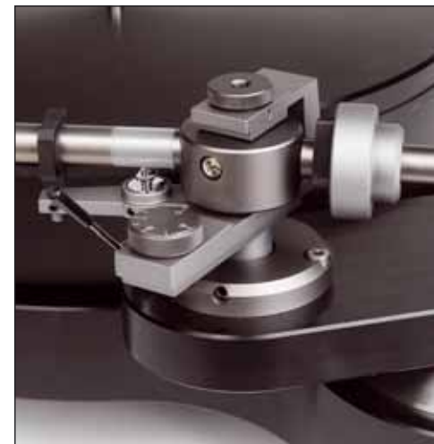
Der AQ-PTg ist in beiden Ebenen kardanis gelagert. Ein transparenter Schumpfschlauch bedämpft das Aluminium-Armrohr